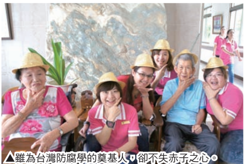
▲雖為台灣防腐學的奠基人，卻不失赤子之心。

們盡心盡力傳揚福音時，就能全然使這生命得著釋放，我們的靈性生命也就能在其中不斷的成長茁壯而有依靠，走在真理的道路上。