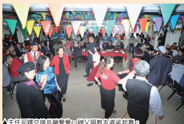
▲主任司鐸交接共融餐會，神父與教友婆婆起舞。

禮成後，柏神父致詞，說出自己一早離開樹林天主堂前，已經寫了一篇短文上傳到臉書，告別樹林天主堂的生活，以及謝謝樹林天主堂教友給他的愛護和支持，當時已經是流著淚在寫，柏神父深深嘆了一口氣，表達了在樹林天主堂是多麼美好、深厚的一段經歷，