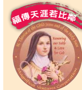
小德蘭福傳之友網站