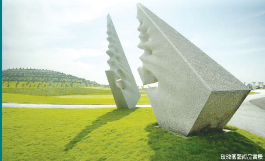
玫瑰園藝術品實景