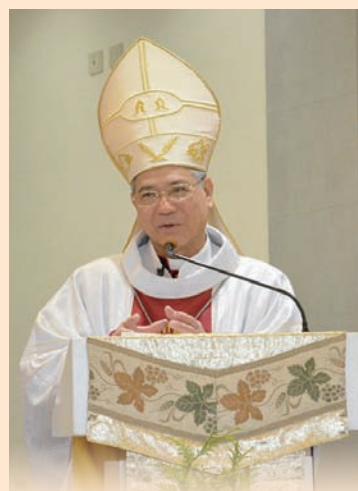
▲洪山川總主教禮彌撒並講道