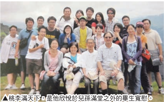
▲桃李滿天下，是他欣悅於兒孫滿堂之外的畢生寬慰。

值此百日追思之際，為公公獻上誠摯地祝禱，感念在主愛滿溢中圓滿走過這恩寵之路，相信他已在天父懷中領首微笑，等待著不遠時日，與我們天鄉重聚！