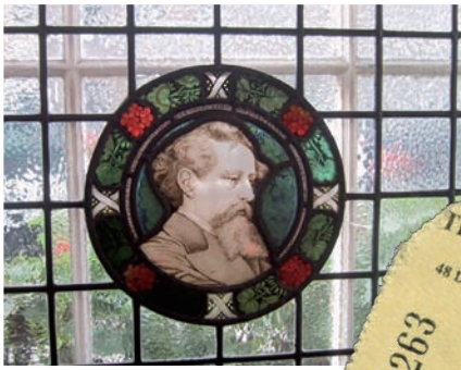
▲狄更斯故居博物館內的肖像彩窗 ▶狄更斯故居博物館的門票