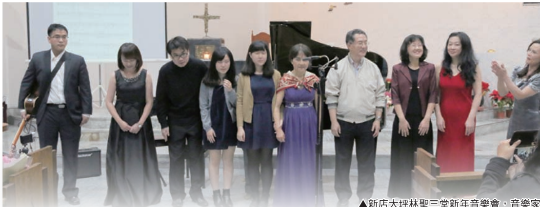
▲新店大坪林聖三堂新年音樂會，音樂家與教友們共同見證〈上主是我良醫〉。