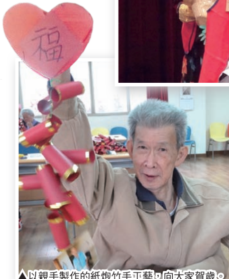
▲以親手製作的紙炮竹手工藝，向大家賀歲。

聖保祿宗徒曾說：「我若傳福音，原沒有什麼可誇耀的，因為這是我不得已的事；我若不傳福音，我便有禍了。假使我自願作這事，便有報酬；若不自願，可是責任已委託給我。」（格前9:16-17），「傳播福音喜訊」是每一個信主得救的人都該做的，也是都樂意做的。在我們得到來自上主的恩寵與助佑時，我們愈能將自己信託和交付出去，愈能以冥冥之中的祂（天主）為依歸，也愈無畏於那未知的回歸之路，也因此，總希望我們的親友都能得著這恩寵，因為，當我