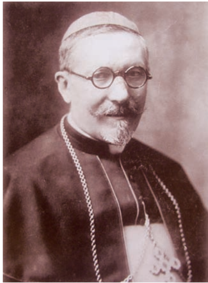
▲中梵關係中重要角色之一：剛恆毅樞機主教 (Celso Costantini)