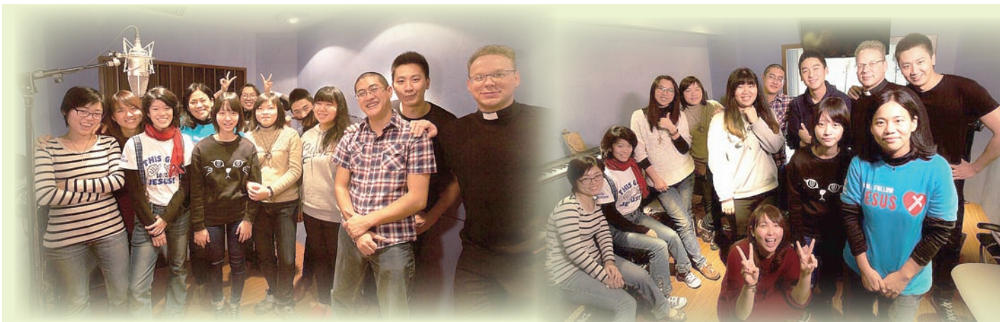
■採訪紀錄／翁毓婷